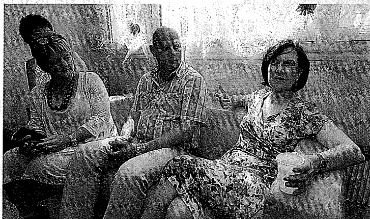
La secrétaire d'État avec les représentants de l'Œuvre normande des mères et du comité d'action et de promotion sociale

Depuis son ouverture en avril 2012, le Pavif a accueilli 280 familles.